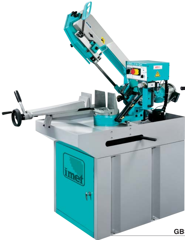
GBS 218 GH