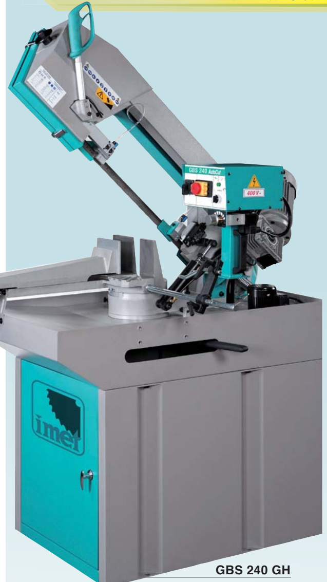
GBS 240 GH

FR - Scies manuelle pour couper de 0° à 60° gauche. Conçues pour coupes de petite charpente.