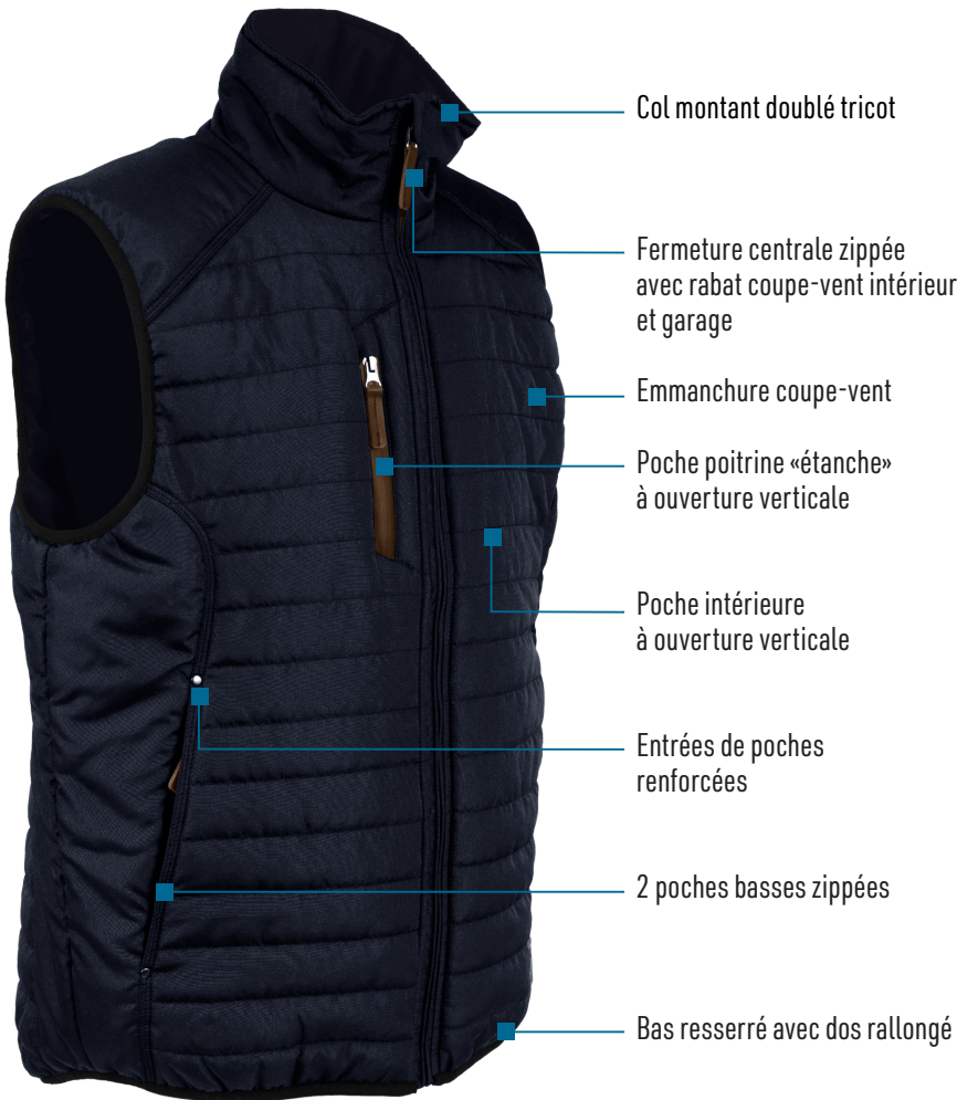
Bleu marine (sept 2022)